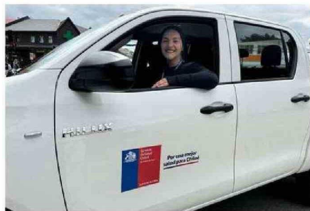
DESTACARON LA UTILIDAD DE LOS MÓVILES EN EL TERRITORIO.

El también alcalde de Quellén recordó que contar con estos nuevos vehículos "no fue un transitar fácil, los recursos no son infinitos, pero pensando en la insularidad del Archipiélago, del bicentenario que se avencina a pasos agigantados,