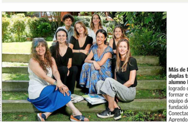
Más de 8 mil duplas tutor-alumno han logrado conformar el equipo de la fundación Conectado Aprendo.