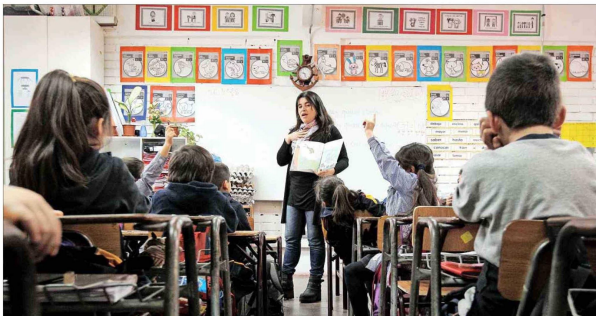
Niños que en la sala de clases presentan dificultad para leer de corrido y comprender lo leído son reforzados a través de 16 sesiones de tutoría online, con una duración de una hora.

Gallego relata que "en Italia, por ejemplo, estudiantes universitarios, prementaban estas tutorías y de ahí partió la colaboración con alumnos que tenían este voluntariado como parte de un