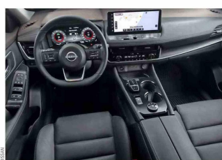
La potencia y aceleración de Nissan X-Trail e-POWER contrasta con la placidez dentro del vehículo. De esta manera, Nissan X-Trail e-POWER no solo ofrece la

De forma similar al absoluto silencio previo a los potentes y ciertos disparos de la tiradora skeet, la potencia y aceleración de Nissan X-Trail e-POWER contrasta con la placidez dentro del vehículo. La conexión del motor eléctrico con las ruedas es capaz de generar una aceleración silenciosa que se conjuga con el control total que ofrece este SUV en cada curva y terreno gracias a su sistema de tracción integral e-4ORICE. Y en cuanto al espacio, este innovador vehículo de Nissan, homologado como el primer vehículo eléctrico de rango extendido en el país, ofrece hasta tres filas de asientos con un amplio espacio de carga trasera, que incluso se hace expandible con los asientos rebatibles. "Siempre ando con muchas maletas: la escopeta, el