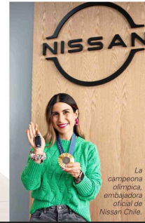
La campeona olímpica, embajadora oficial de Nissan Chile.