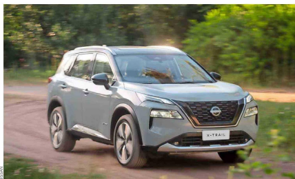
La extraordinaria capacidad de esta SUV electrificada, traducida en una autonomía capaz de superar los 950 kilómetros, radica en sus dos motores eléctricos que impulsan al vehículo en todo momento y que se abastecen de un pequeño motor a gasolina, que funciona como generador, para recargar las baterías.