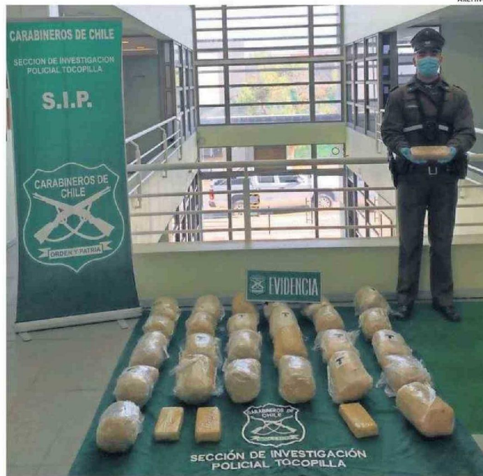
LA LABOR PREVENTIVA E INVESTIGATIVA DE CARABINEROS SE HA FORTALECIDO EN LOS ÚLTIMOS AÑOS.

Además, de vuelos de drones en las playas del sector sur de Tocopilla durante las tardes y noches de los viernes, sábados y