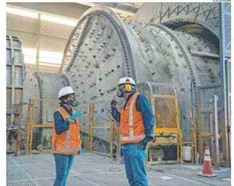
LA MINERÍA SERÁ CADA VEZ MÁS INTENSIVA EN EL CONSUMO DE AGUA.

Entre las plantas operativas figuran Planta José Antonio Moreno de Enami; Las Cenizas; Mantos de Luna; Planta Coloso de Minera Escondida BHP; Distrito Centinela de Antofagasta Minerals; Sierra Gorda de KGHM; Antucoya de Antofagasta Minerals; Water Supply Extension (WSE) de Minera Escondida BHP; Michilla