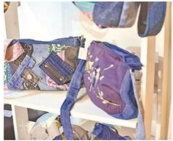
Carteras sustentables es parte de los productos que más se venden.

Otro de los éxitos del negocio son las carteras de jeans reciclados y los guateros para mascotas, diseñados especialmente para aliviar los dolores de ani-