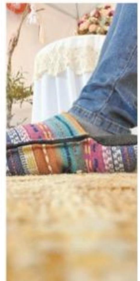
"Ratonas Costureras" es parte de Amapuq, una asociación de emprendedores locales.

» Otro de los éxitos del negocio son las carteras de jeans reciclados y los guateros para mascotas, diseñados especialmente para aliviar los dolores de animales de mayor edad