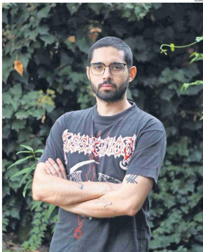
"ME PARECIÓ UN DEBER PUBLICAR ALGO PARA QUE SE HABLE DEL TEMA" SALUD MENTAL, DICE EL AUTOR.

— Afortunadamente soy independiente, no tengo que darle explicaciones a nadie y para mí es un tema súper importante: así como hay gente que tiene la bandera de lucha de los pueblos indígenas u otra causa, mi bandera es la salud mental, y tengo el privilegio de que se me da la escritura, que sé mucho del tema y me pareció más bien un deber publicar algo para que se ha-