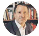
MARIO MARCEL Ministro de Hacienda

Va a generar más disponibilidad de fondos para financiar proyectos de inversión y financiar proyectos de vivienda”.