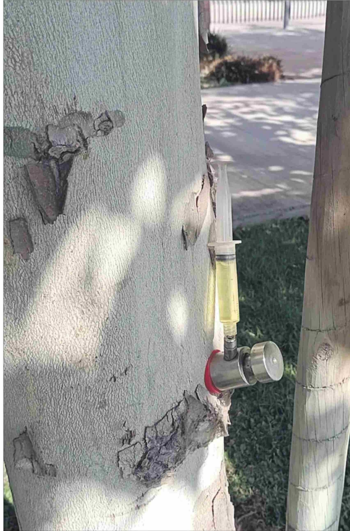
La inyección consiste en un fungicida Phyton para atacar el hongo oídio.

Rojas detalla que el caso icónico de la comuna es un ejemplar de la especie celtis australis -también conocido como Almez- que está ubicado en calle O'Brien y supera los 10 metros de largo.