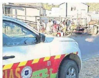
FUNCIONARIOS MUNICIPALES DEBIERON ATENDER DIVERSAS EMERGENCIAS DE SUS VECINOS.