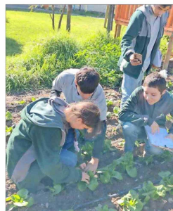
Las crisopas, un insecto de color verde, es la especie que eligieron para esta biofábrica de "insectos benéficos".

Destaca que durante el proceso, los estudiantes cumplen distintos roles: "Pasan de ser escritores a ser editores, a ser diseñadores gráficos y a ser programadores. Y el hecho de que estén trabajando en grupo también promueve la cooperación entre ellos y que cada uno cumpla un rol en ese grupo de trabajo".