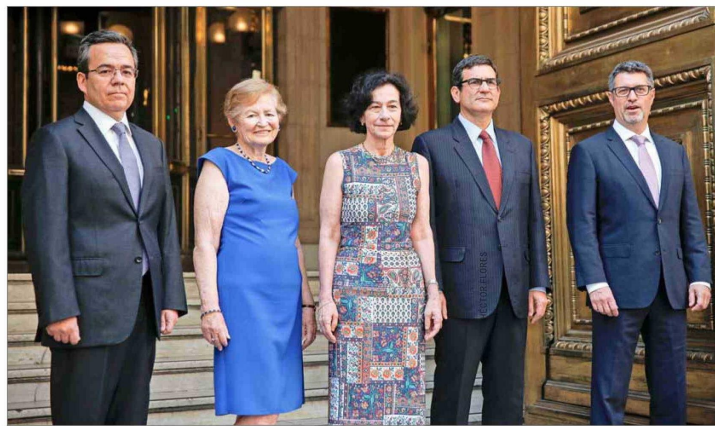
Desde mediados de diciembre de 2024 que el Consejo del Banco Central fijó la Tasa de Política Monetaria en el nivel actual de 5% anual.