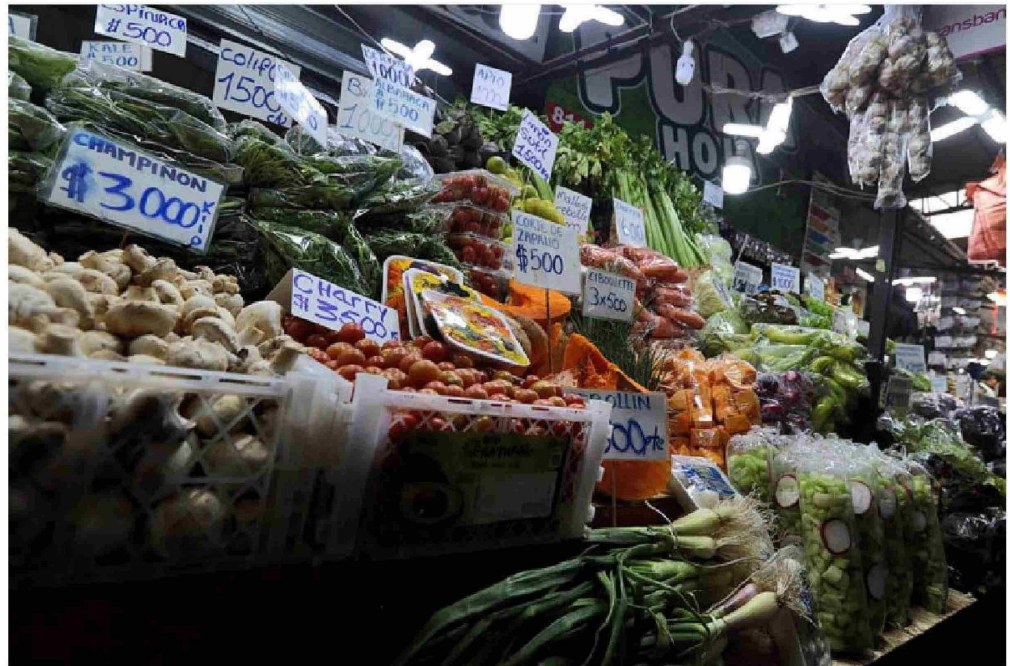
VARIACIÓN SEMANAL DE PRECIOS DE HORTALIZAS

En detalle la papa en ferias libres promedió un valor de $877 el kilo, lo que equivale a un incremento de 12,7%. El pimiento subió un 7,8%, lo que representa cerca de $40 más por unidad hasta los $556 por cada uno.