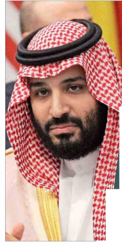
Mohammed bin Salman, príncipe heredero de Arabia Saudita.

crecimiento de Brasil mediante una política industrial, un aumento de los flujos de inversión sauditas es igualmente atractivo. El Presidente visitó el reino en noviembre, mantuvo conversaciones con MBS, como se conoce al príncipe heredero, y dijo en un seminario con empresarios que dentro de una década "Brasil será conocido como la Arabia Saudita de la energía verde".