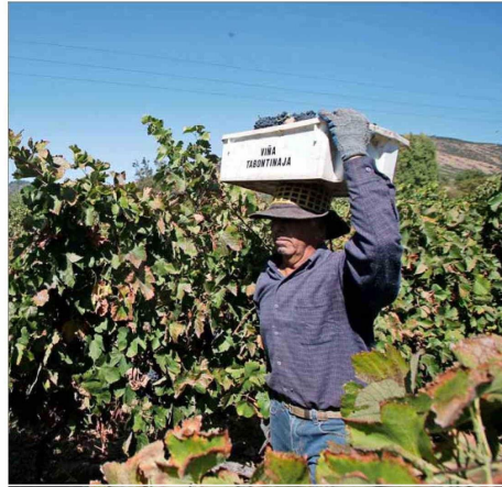
La SNA asegura que en el sector silvoagropecuario han debido modificar la frecuencia de riego y evitar las labores en los horarios de mayor temperatura.

“Hay que ajustar el tiempo y la frecuencia de riego a los requerimientos de los distintos cultivos para no producir deshidratación en las plantas (...), y también todos los agricultores tenemos que preocuparnos de evitar labores agrícolas en las horas de máxima temperatura, para no contribuir a aumentar