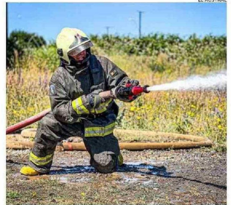
BOMBEROS EXTINGUIÓ EL FUEGO ILEGAL EN LA PARCELA DE PELLECO.