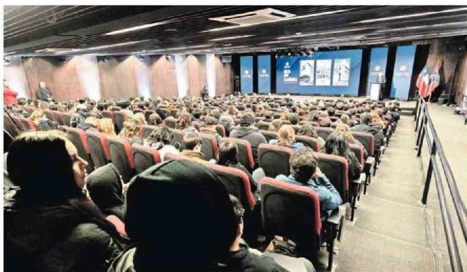
Con un importante marco de público contó la actividad desarrollada esta semana en Concepción.

chan diariamente contra la pobreza extrema.