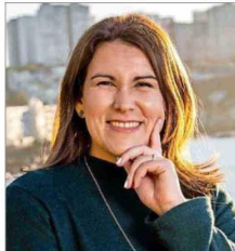
UNIVERSIDAD DE LOS ANDES

“La modalidad de libre elección cubre menos, por tanto el copago es un poco más alto. Lamentablemente el sistema no es perfecto, pero es un costo que debe asumir el afiliado por agilizar atenciones”.