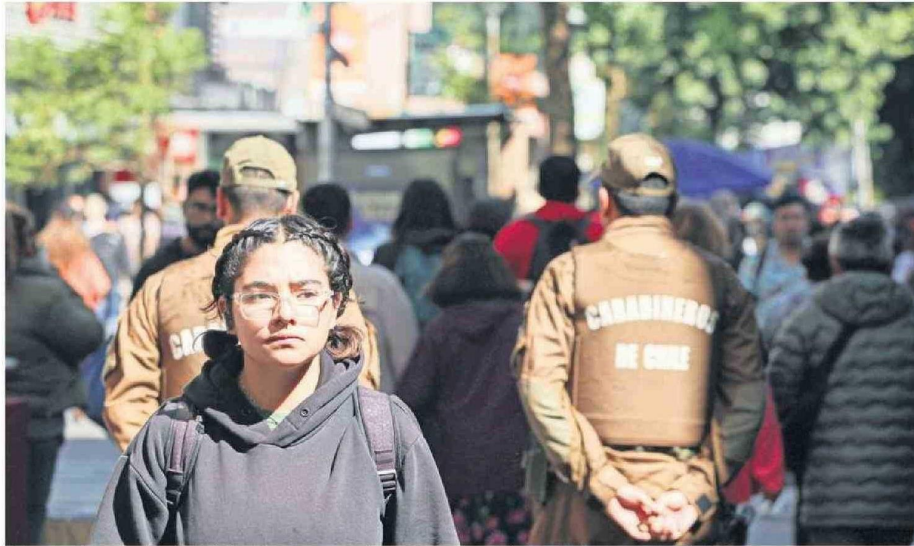
Además del personal habitual de Carabineros se suman las unidades especializadas y de la Escuela de Suboficiales.

También comentó que este trabajo se aplicará en lugares donde