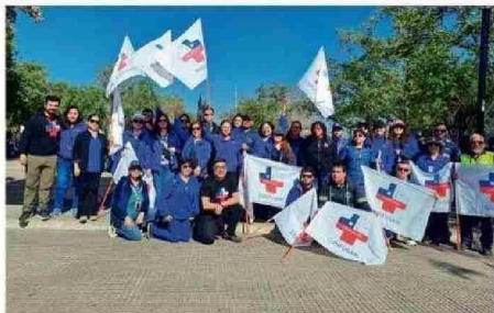
CONFUSAM SE MANIFESTÓ EN SEPTIEMBRE CONTRA LA VIOLENCIA.

hay cosas que no se denuncian, que están normalizadas, como el caso de Bellavista, que es lo más crítico. La gente de Santiago viene con otra actitud, amenazan, golpean los vidrios del Some, amenazan a los funcionarios. Como se ha hecho recurrente, se ha nor-