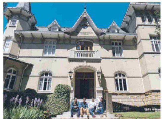
Campus Monseñor Alejandro Mechaca Lira.