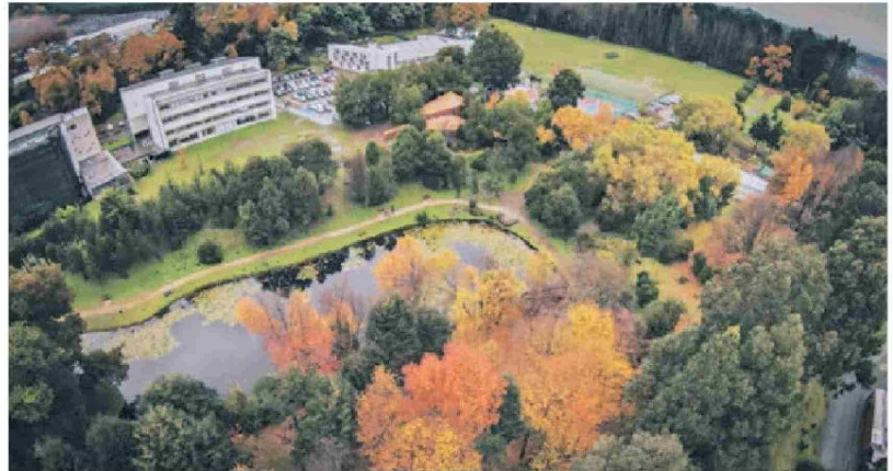
Campus San Juan Pablo II.

trícula incluye un porcentaje significativo de estudiantes mapuche, y contamos con programas que fomentan el diálogo de saberes, como el Instituto Ta ñi Pewam, que busca integrar perspectivas culturales y académicas.