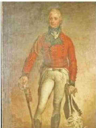
Sir Thomas Picton.

bierno de la República de Chile y el gobierno de la República de Argentina el Tratado de Paz y Amistad; la nación argentina reconoció la soberanía chilena sobre las islas del Beagle, en especial sobre la isla Picton.