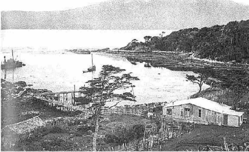
Isla Picton hacia 1915.

Tiraje: 3.000 Lectoría: 9.000 Favorabilidad: No Definida