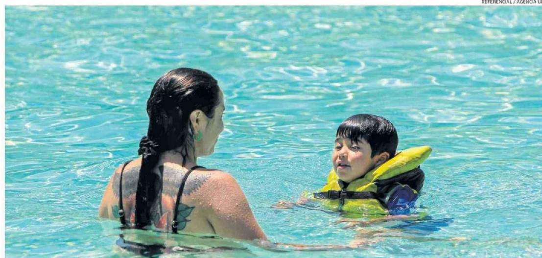
ANTE CUALQUIER INFRACCIÓN QUE DETECTE, DEBE PRESENTAR UNA SOLICITUD DE FISCALIZACIÓN EN EL SITIO WEB DEL MINSAL.

Las principales condiciones que se verifican en las fiscalizaciones son: contar con autorización sanitaria que permite su funcionamiento, calidad del agua de la pileta de manera tal que contenga los niveles de Cloro y pH re-