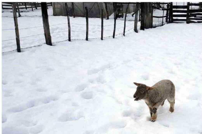
LA FALTA DE ALIMENTO PARA LOS ANIMALES PREOCUPA A LOS CAMPESINOS DE LA PROVINCIA DE PALENA.

Desde las gestiones parlamentarias, el diputado Héctor Ulloa comentó que, junto con conversar con agricultores afectados, sostuvo contacto con distintos ministros de Estado para garantizar recursos para las familias afectadas.