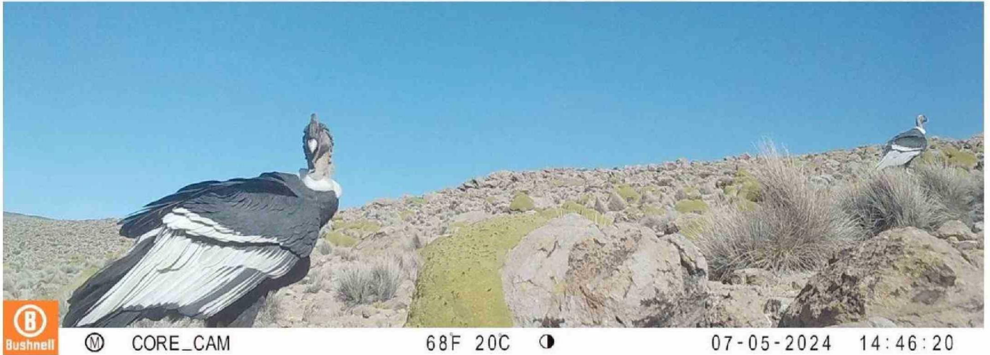
LAS IMÁGENES DE LA "CÁMARA TRAMPA" MUESTRAN A UN IMPONENTE CÓNDOR MACHO UBICADO MUY CERCA DE LA LENTEÓS, SEDUCIENDO A UN EJEMPLAR HEMBRA.