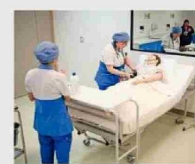
Estudiantes de la carrera Técnico en Enfermería desarrollan prácticas en el Centro de Simulación de Salud del campus.

Esto proporciona un entorno propicio para el aprendizaje, la experimentación y la creatividad, preparando a los estudiantes para los desafíos del mundo laboral actual. Además, al ser una institución acreditada, cuenta con todas las opciones de financiamiento estatales, como becas y créditos.