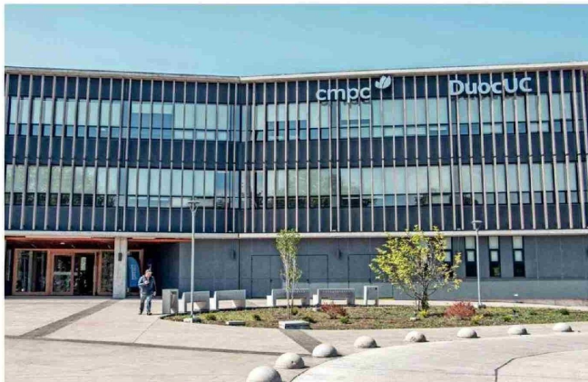
El edificio de educación superior se construyó con altos estándares de habitabilidad, dando espacio a la madera como un elemento central de su diseño.