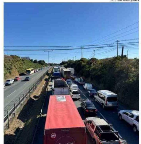
ESTE ERA EL PANORAMA AYER, CERCA DE LAS 18 HORAS EN LA RUTA 5.

vehículo que transportaba material en descomposición. "Se trabajó en la realización de diques para que el material no se siguiera propagando", agregó.