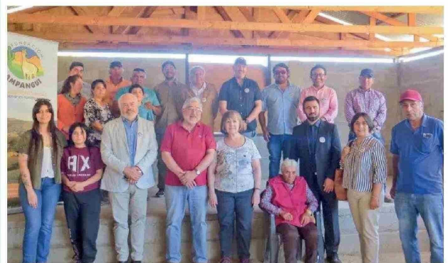
La Fundación Llampangüi celebró este año dos décadas de existencia.