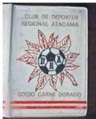
CARNE DE SOCIO DORADO.