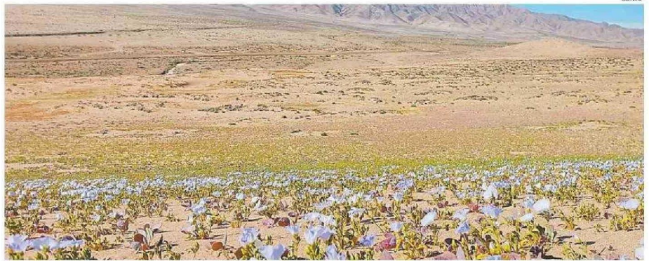
SU DURACIÓN DEPENDERÁ DE LAS CONDICIONES ATMOSFÉRICAS EN LA ZONA.