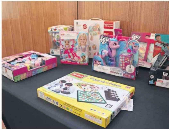
ESTE AÑO SE INCLUYERON REGALOS INCLUSIVOS PARA NIÑOS CON DISTINTAS CONDICIONES.