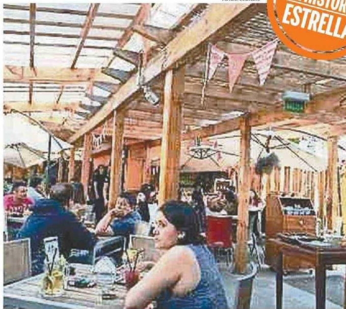
EN "LA COCINA" OFRECEN ENSALADAS CÉSAR, IDEALES PARA LOS DÍAS DE CALOR, EN CONCEPCIÓN.

prefiere no salir de la ciudad, le contamos que en el segundo piso del Mercado del Gran Concepción (Avenida O' Higgins 50, entre las calles Alberto Hurtado y Arturo Prat) se pueden encontrar todos los productos del mar, preparados con cariño y dedicación por los variados locales que conviven en un espacio limpio y confortable.