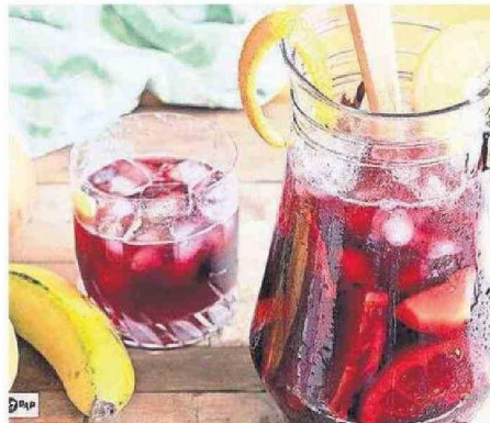
LAS SANGRÍAS SON DISFRUTADAS CON PASIÓN POR ALGUNOS.

"Llevamos mucho tiempo en este trabajo, por lo que ya somos conocidos. La gente nos distingue con su presencia y nosotros respondemos con cariño. Si me preguntas cu-