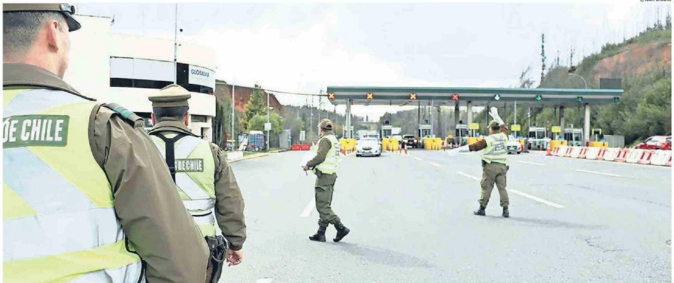
LA RUTA CABRERO-CONCEPCIÓN Y LA AUTOPISTA DEL ITATA, FUERON LOS ACCESOS MÁS UTILIZADOS POR LOS PENQUISTAS PARA REGRESAR A LA ZONA, LO QUE SE REGISTRÓ AYER DURANTE TODA LA JORNADA.