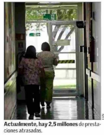
Actualmente, hay 2,5 millones de prestaciones atrasadas.