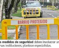
Las medidas de seguridad deben involucrar un esfuerzo mancomunado entre diversas instituciones, plantean especialistas.

A juicio de Greene, "existen programas de barrios críticos en donde se focalizan los recursos, pero eso no ha sido suficientemente exitoso este año porque el fenómeno delictual en Chile ha cambiado muy rápidamente este último tiempo".