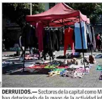
DERRUIDOS.— Sectores de la capital como Meiggs o la Vega Central se han deteriorado de la mano de la actividad informal.