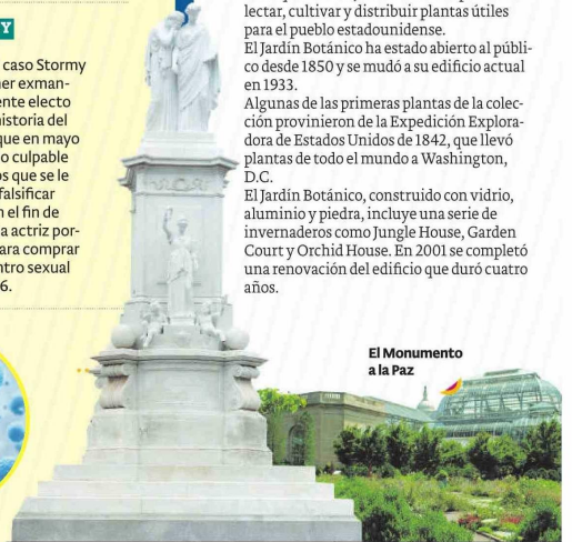
El Monumento a la Paz

El Jardín Botánico es el jardín de este tipo más antiguo del país. La idea se remonta a los primeros presidentes: Washington, Madison y Jefferson. Ellos querían un Jardín Nacional para recolectar, cultivar y distribuir plantas útiles para el pueblo estadounidense. El Jardín Botánico ha estado abierto al público desde 1850 y se mudó a su edificio actual en 1933. Algunas de las primeras plantas de la colección provinieron de la Expedición Exploradora de Estados Unidos de 1842, que llevó plantas de todo el mundo a Washington, D.C. El Jardín Botánico, construido con vidrio, aluminio y piedra, incluye una serie de invernaderos como Jungle House, Garden Court y Orchid House. En 2001 se completó una renovación del edificio que duró cuatro años.