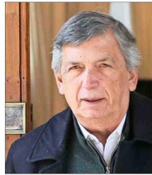
Lautaro Carmona, presidente del PC.

En conversación con Radio Nuevo Mundo, el presidente del PC, Lautaro Carmona, criticó el régimen de visitas bajo el cual se encuentra Jadue, y manifestó que "se lo hemos pedido incluso al propio subsecretario de Justicia (Jaime Gajardo), a quien conocemos mucho, porque es de nuestra militancia, por qué no se ha afinado un reglamento que sea para todos por igual". Apuntó, en ese sentido, que "no estamos pidiendo privilegios para Daniel (Jadue), pero para todos por igual. No es bueno esto, no le hace bien. Es casi abusar de la condición de 'acá