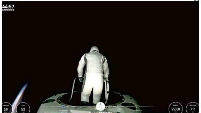
EL MULTIMILLONARIO JARED ISAACMAN SALE A LA CAMINATA.

La salida al espacio de ambos astronautas se dio por concluida con éxito a las 07.58 hora de Estados Unidos. c3f