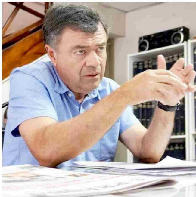
El ministro de Agricultura, Esteban Valenzuela, asegura que el precio de las cerezas en el mercado chino se recuperará rápidamente.

• Pese a la inquietud de los agricultores maulinos, el secretario de la cartera más importante para la región asegura que finalmente las cifras serán positivas y que "(los precios de la cereza) ya están teniendo un rebrote, está en 3 dólares 30 por kilo y mientras nos acercamos al Año Nuevo Chino hay expectativas de que el precio mejore, hacia fin de mes".