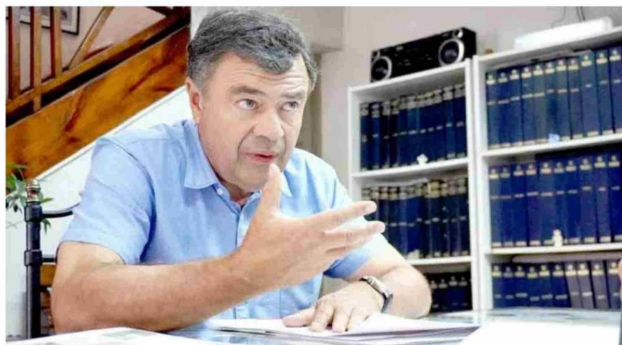
"No concuerdo con el gobernador (Pedro Álvarez-Salamanca) de que Maule está con una agricultura deprimida. Todo lo contrario", señala el ministro.

los árboles dejan caer miles de hojas que para Valenzuela "hacían un paisaje más romántico".