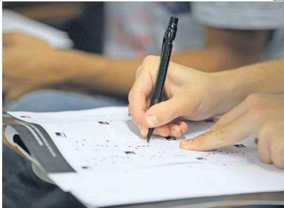
LA PRÓXIMA SEMANA SE LLEVARÁ A CABO UN NUEVO PROCESO DE PRUEBA DE ADMISIÓN A LA EDUCACIÓN SUPERIOR (PAES 2025).

dica que es muy importante tener un "plan B". "En caso de que las cosas no salgan como las tiene planificadas. Entender que el resultado de la evaluación no es definitivo. El resultado que el estudiante obtenga no solo depende del alumno, sino que depende de un conjunto de otros factores", precisa Navarro.