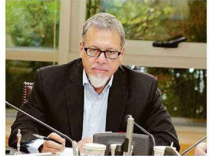
SENADOR PIDIÓ CLARIDAD AL MINEDUC SOBRE EL PROCESO.