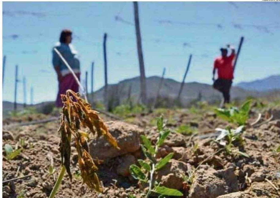
AGUA CAÍDA Y NIEVE EN CORDILLERA HACEN PREVER UNA POSITIVA TEMPORADA DE RIEGO.

En cuanto a cómo va el rubro productivo considerando que se estima que sea un año de buena comercialización, tal cual lo han demostrado algunas cifras de exportación, el agricultor agregó que "es lo que esperamos todos los años, tener una buena comercialización. Con respecto al