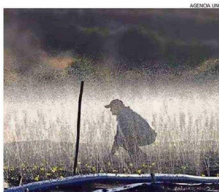
PROYECTAN TEMPORADA EN INICIO DE PRIMAVERA.

Referente a si el agua caída durante el invierno se pudo acumular para ser aprovechada de mejor manera en la agricultura, Gatica agregó que "la cordillera, que es nuestro embalse natural, tiene bastante nieve para esta temporada, pero eso no implica descuidarnos con el tema de la construcción de los embalses, que es completamente necesario. Desgraciadamente el agua caída no se pudo acumular, por la falta de embalses, por ende, el 80% del agua caída se va al mar, pero con las últimas precipitaciones, los suelos están saturados y no deberíamos tener problemas de riego para los cultivos y más aún con la cantidad de nieve caída tene-