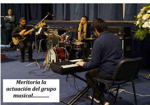
Meritoria la actuación del grupo musical.....