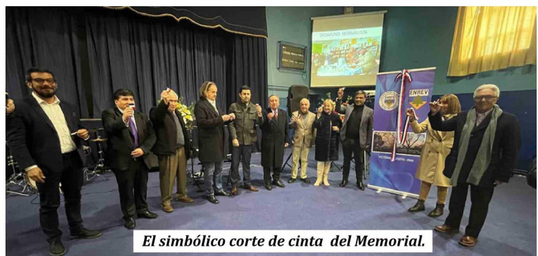
El simbólico corte de cinta del Memorial.