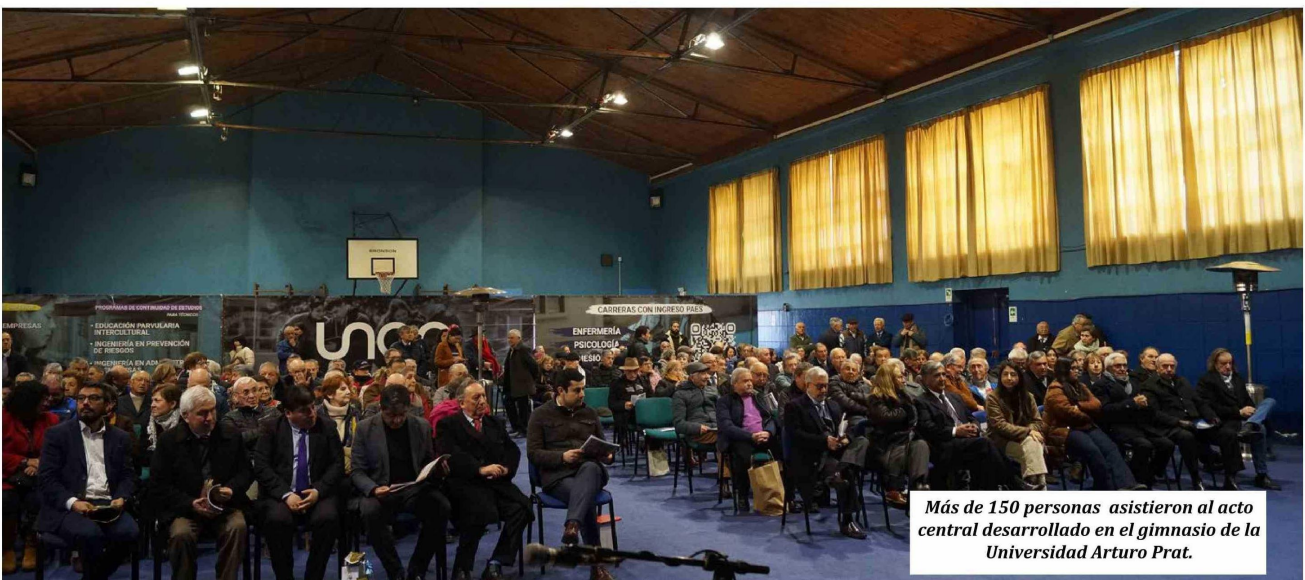
Más de 150 personas asistieron al acto central desarrollado en el gimnasio de la Universidad Arturo Prat.

Tras la finalización del acto central, que cerró con el corte simbólico de la cinta de inauguración del Paseo y con la entonación del Himno de la Escuela Normalista, los asistentes compartieron un vino de honor y luego fueron al Memorial para pasear oficialmente por él por primera vez y tomar algunas fotografías.