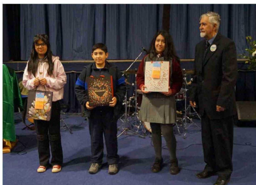
Ganadores premios del concurso de pintura