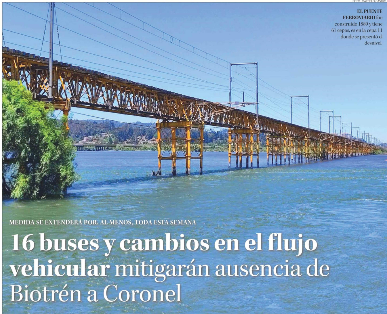
EL PUENTE FERROVIARIO fue construido 1889 y tiene 61 cepas, es en la cepa 11 donde se presentó el desnivel.

MEDIDA SE EXTENDERÁ POR, AL MENOS, TODA ESTA SEMANA