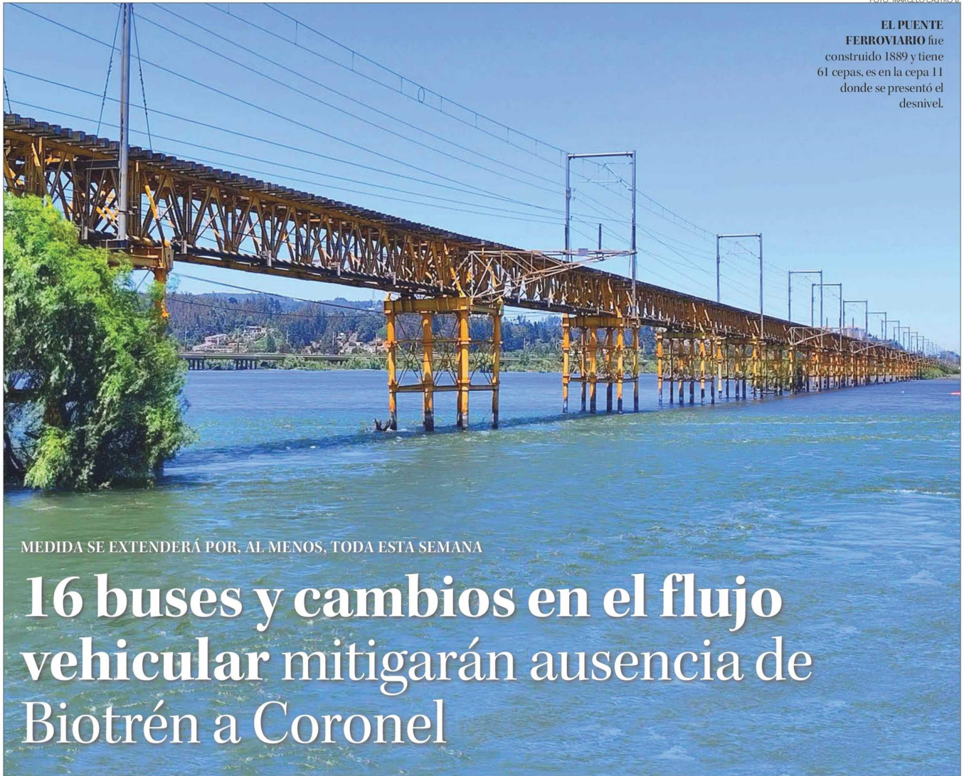
EL PUENTE FERROVIARIO fue construido 1889 y tiene 61 cepas, es en la cepa 11 donde se presentó el desnivel.

MEDIDA SE EXTENDERÁ POR, AL MENOS, TODA ESTA SEMANA