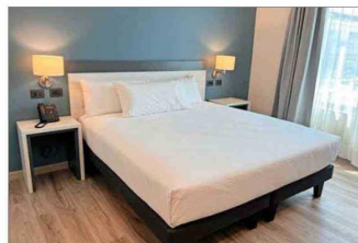
El hotel ya tiene instaladas las camas en las habitaciones.