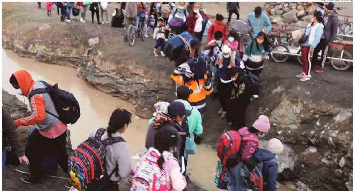
EL NORTE ES UNO DE LOS PUNTOS POR DONDE INGRESAN EXTRANJEROS AL PAÍS, COMO EN LA COMUNA DE COLCHANE, REGIÓN DE TARAPACÁ.

En su análisis, sostiene que desde que se elaboró este estudio y a la fecha la situación ha experimentado algunos cambios. De partida, el número de haitianos ha disminuido, asegura.