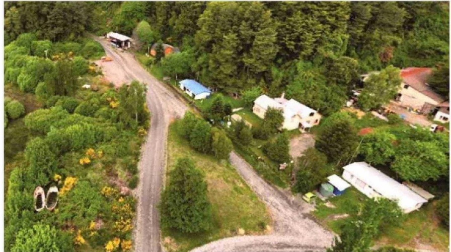
PEULLA, EN PUERTO VARAS, SE UBICA UNO DE LOS PASOS QUE CONTROLA LA POLICÍA DE INVESTIGACIONES EN LA REGIÓN.

Como dato estadístico, indica que en la región se han efectuado unas 90 fiscalizaciones anuales, a lo que se suma el proceso de auto-denuncia, instancia en que se denuncia a todo aquel