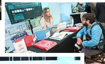
Las diversas fundaciones que participaron del encuentro explicaron los proyectos que están impulsando para la revitalización de los espacios públicos.