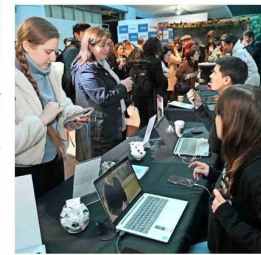
Los asistentes recorrieron los diferentes stands de las fundaciones y universidades que colaboraron en esta 13ª versión de la conferencia organizada por la CChC.