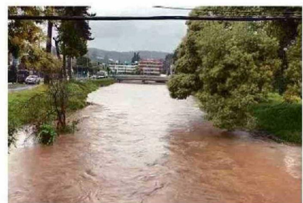
EL ESTERO DE REÑACA SE DESBORDÓ EN LAJARILLA Y AMENAZÓ CON SALIRSE EN LA PARTE BAJA.