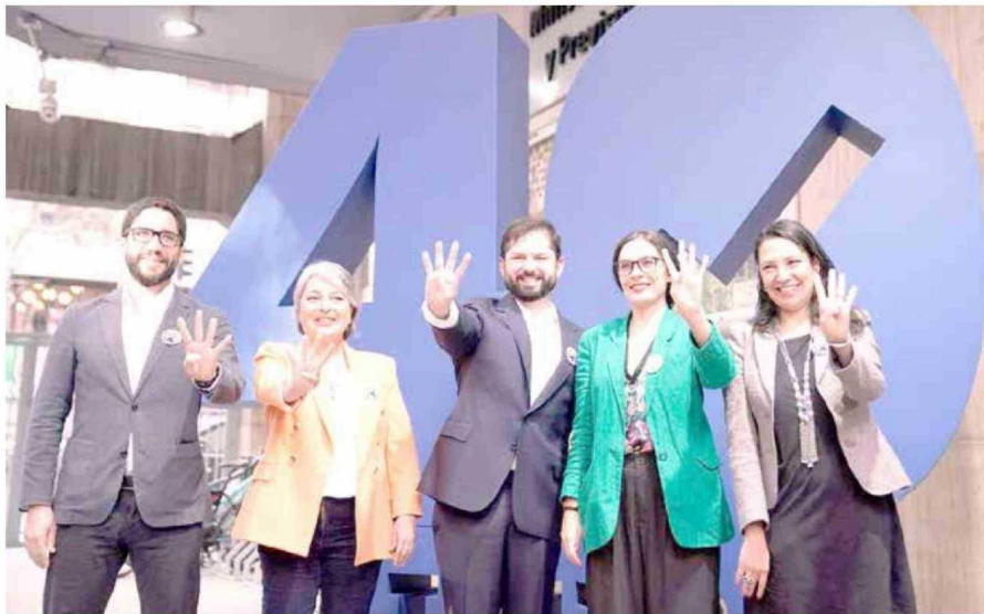
El Presidente Gabriel Boric celebró la aprobación y posterior promulgación de la Ley 40 horas, que reduce la jornada laboral de quienes se rigen por el Código del Trabajo.