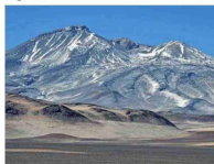
Nevado Tres Cruces.