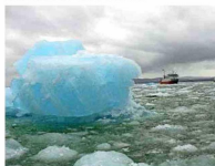
Laguna San Rafael.