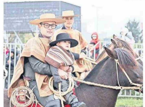
FAMILIAS LIGADAS A LAS TRADICIONES CHILENAS EN LA PARADA.

“ Conmemoramos 214 años desde que se creara la Primera Junta de Gobierno”